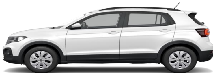
قیمت ۱۷۸ هزار رئال - Taos