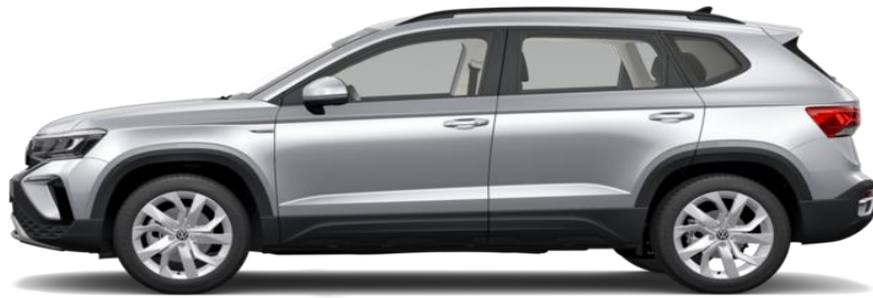
قیمت از ۲۱۵ هزار رئال – Jetta