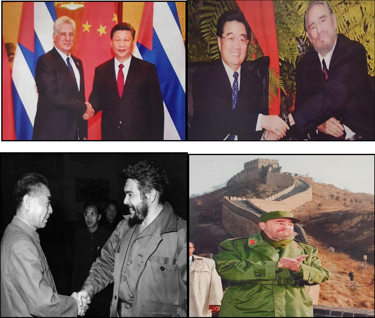
دیدارهای دوجانبه مقامات عالی رتبه کوبایی - چینی