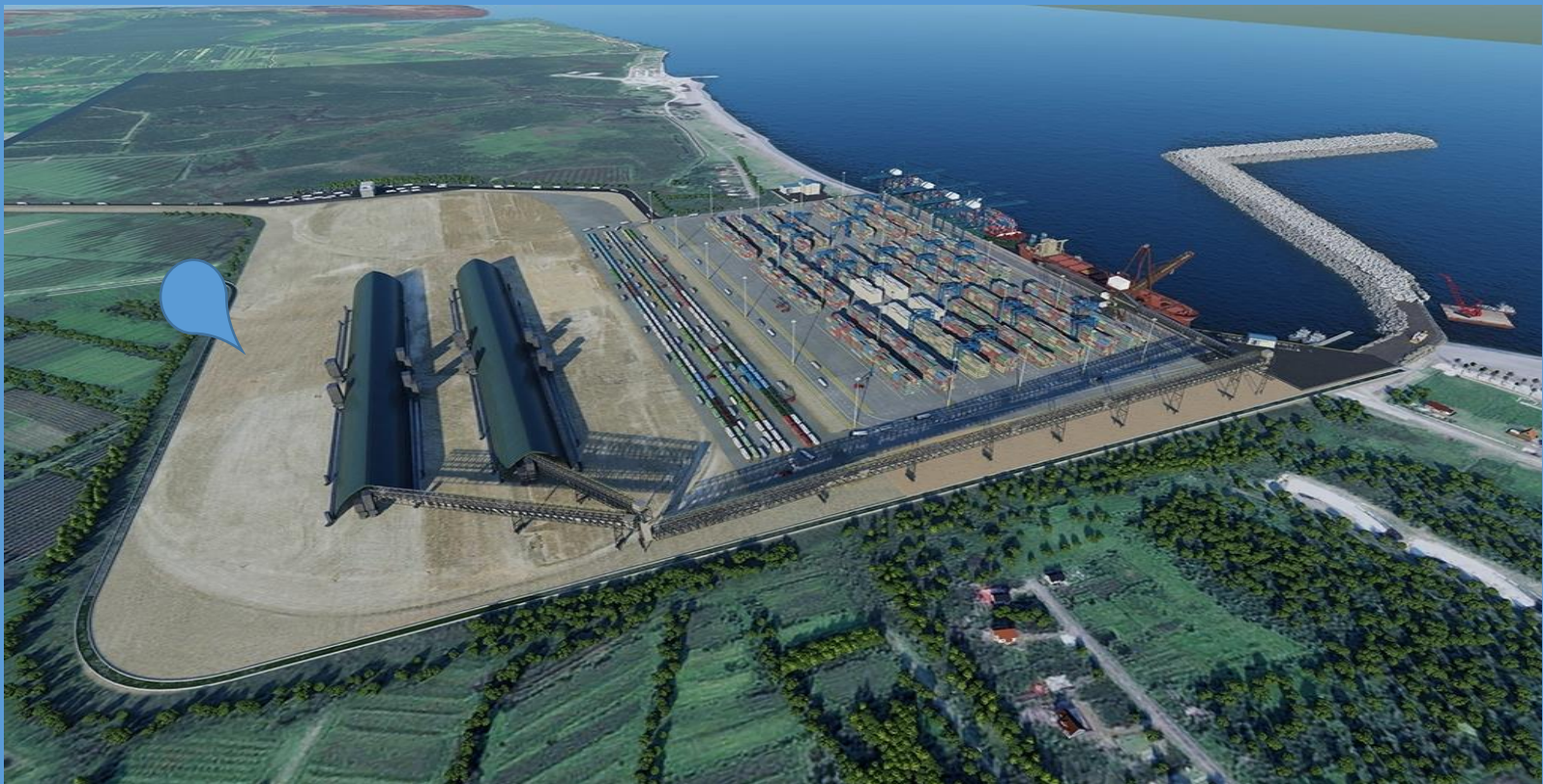
بندر دریایی آنالیا: