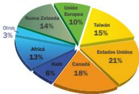
Exportaciones por destino ZAFRA 2018/2019 (Preliminar)

شکر از مهمترین محصولات صادراتی نیکاراگوا است که از طریق بندر کورینتو در دسترس خریداران قرار می گیرد. محموله های شکر ۱۰ درصد از کل حمل و نقل محموله ها در این بندر را به خود اختصاص داده اند. مقاصد اصلی صادراتی شکر عبارتند از: آمریکا، اتحادیه اروپا، کره جنوبی، آفریقا، هائیتی و سایر کشورها.